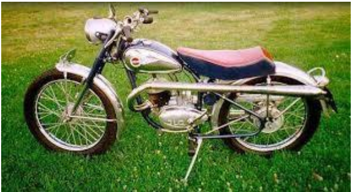
Monark Blue Fighter 1954